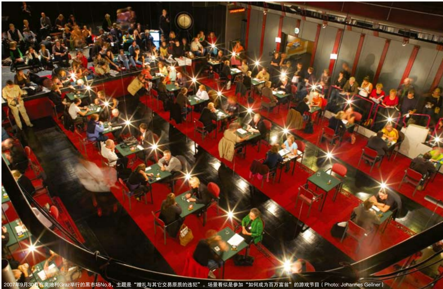
2007年9月30日在奥地利Graz举行的黑市场No.8, 主题是“赠礼与其它交易原质的违犯”。场景看似是参加“如何成为百万富翁”的游戏节目