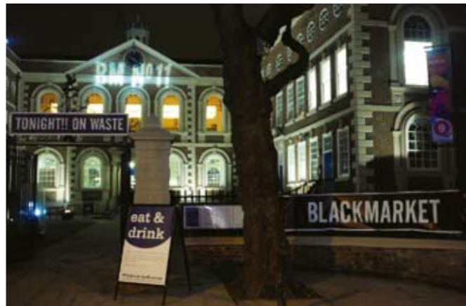
利物浦黑市场合作单位The Bluecoat的入口上写着“今日是关于浪费！”