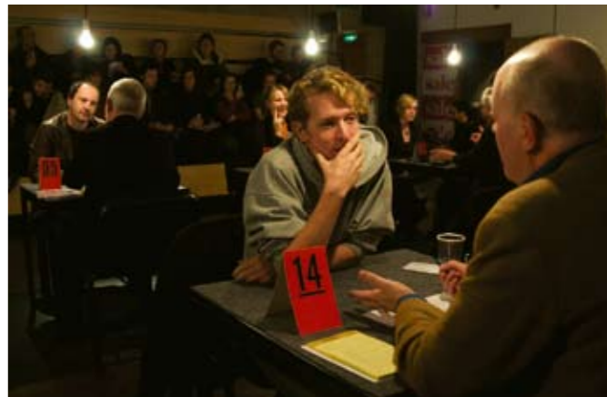
2008年11月29日在利物浦举行的黑市场No.11, 专家向听众讲解垃圾的知识

究竟什么是“非知识”？Hurtzig解释说“‘非知识’可以是一种还未找到语言的知识，即未能用说话去表达，仍然在寻找沟通的形态和过程。又或者，一种难以明言的知识，只能透过暗地里传播，就如一个公开的秘密。当然还有的，就是像信念，或者那些被审查被压制的知识。我相信德国社会学家Niklas Luhmann的一句名言：当一个人学习时，他首先要弃掉曾经学过的某些东西。因此，在每种不同的知识里，都有着‘非知识’的种子。”而黑市的意思，大抵是这种知识实在很难在别的地方选购得到。